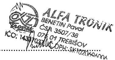
konateľ za zhotoviteľa