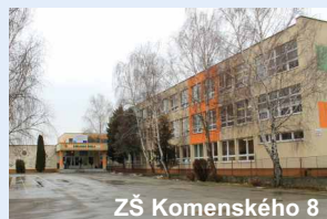
ZŠ Komenského 8

ZŠ na ulici Ivana Krasku 342/1 v Trebišove: k zápisu je potrebný rodný list dieťaťa, zdravotný preukaz dieťaťa, občiansky preukaz zákonného zástupcu.