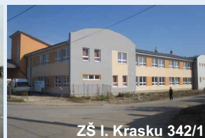
ZŠ I. Krasku 342/1