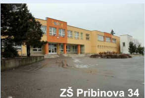
ZŠ Pribinova 34