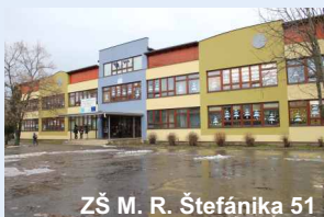
ZŠ M. R. Štefánika 51