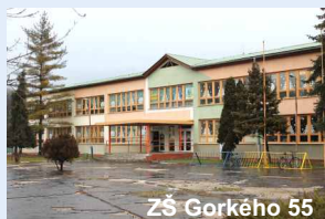
ZŠ Gorkého 55