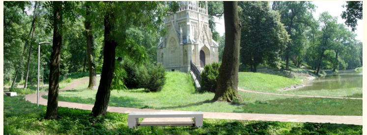
Rekonštrukcia Domu smútku