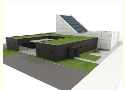
Nový vstup a parkovisko pre areál cintorína