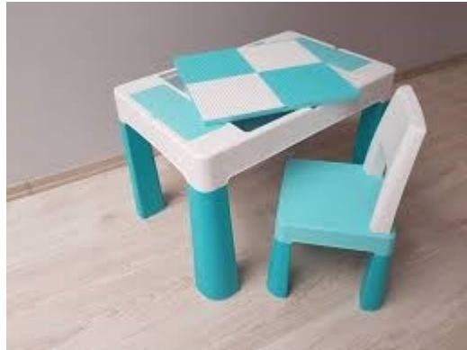
Obrázok 6 Ilustračný obrázok – stoličková sada multifun