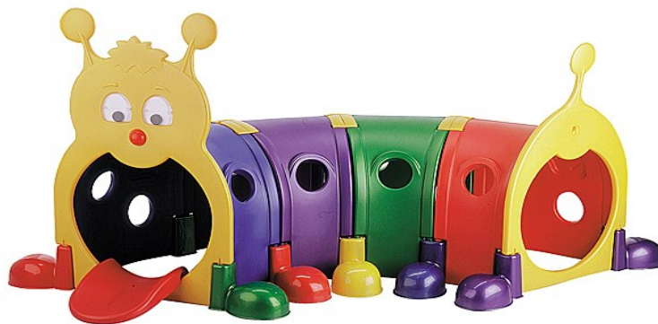
Obrázok 7 Ilustračný obrázok – tunel