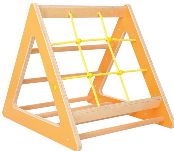
Obrázok 9 Ilustračný obrázok – gymnastický trojuholník