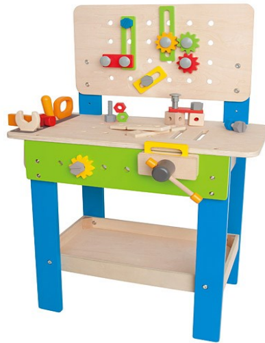
Obrázok 4 Ilustračný obrázok – dielnička pre chlapcov