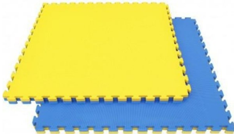
Obrázok 11 Ilustračný obrázok – tatami