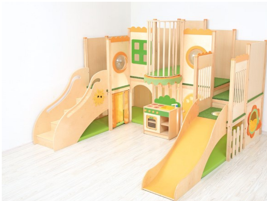
Obrázok 1 Ilustračný obrázok – interiérový hrací kútik