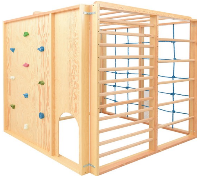
Obrázok 8 Ilustračný obrázok – lezecká kocka