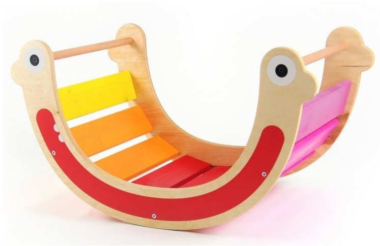
Obrázok 5 Ilustračný obrázok – kolíska s ďalším využitím