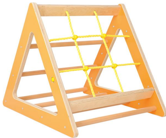
Obrázok 8 Ilustračný obrázok – gymnastický trojuholník