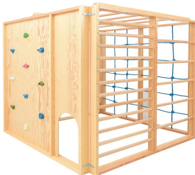
Obrázok 7 Ilustračný obrázok – lezecká kocka