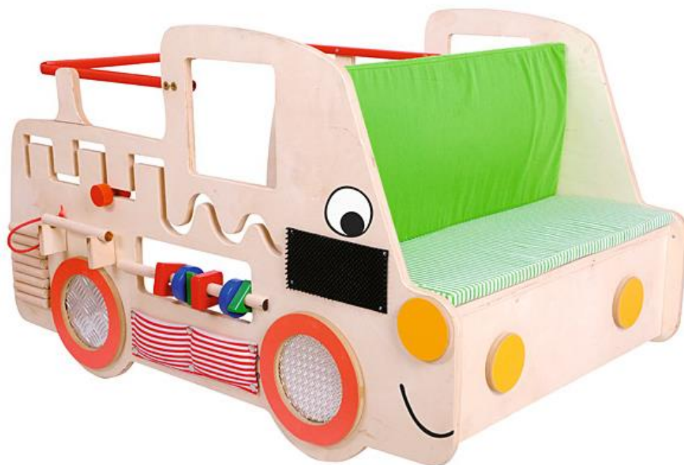
Obrázok 2 Ilustračný obrázok – manipulačný hrací prvok