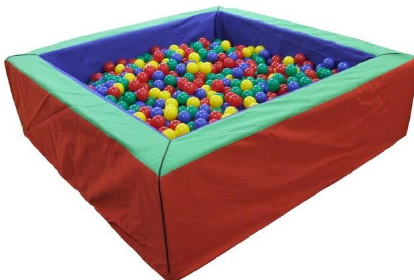
Obrázok 3 Ilustračný obrázok – guličkový bazén