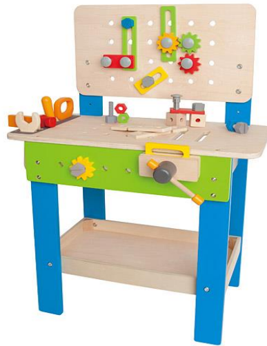
Obrázok 4 Ilustračný obrázok – dielnička pre chlapcov