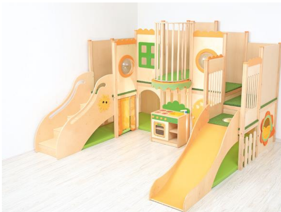
Obrázok 1 Ilustračný obrázok – interiérový hrací kútik