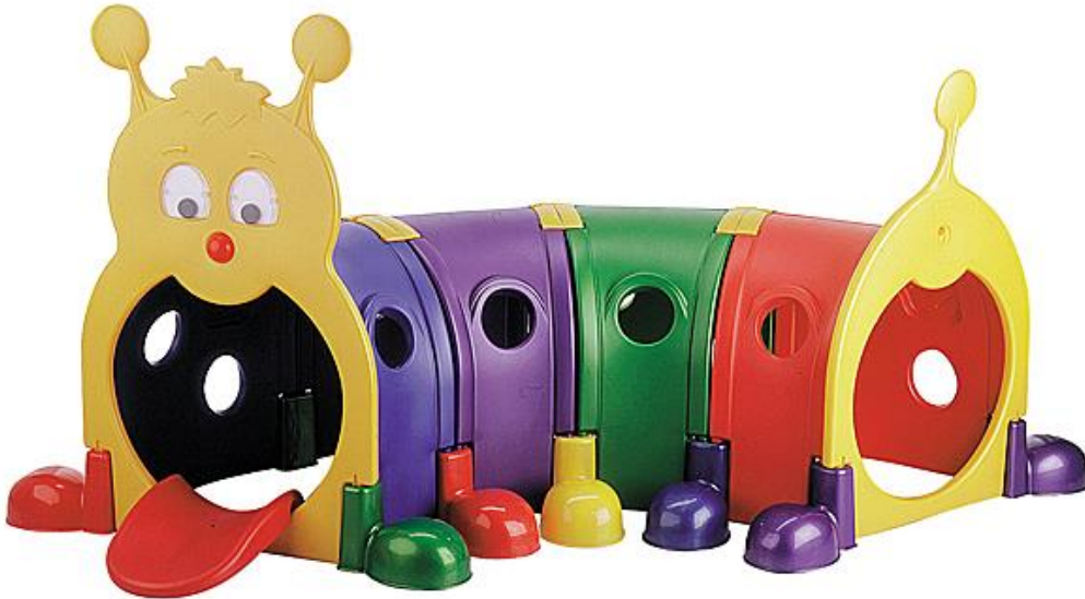
Obrázok 6 Ilustračný obrázok – tunel