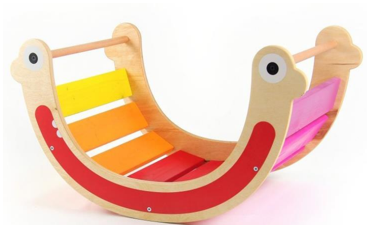
Obrázok 5 Ilustračný obrázok – kolíska s ďalším využitím